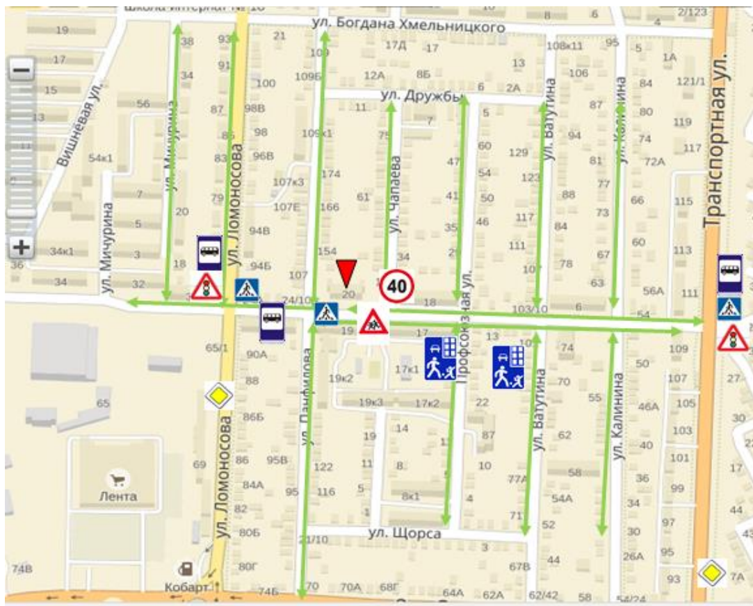
МБДОУ д/с №39